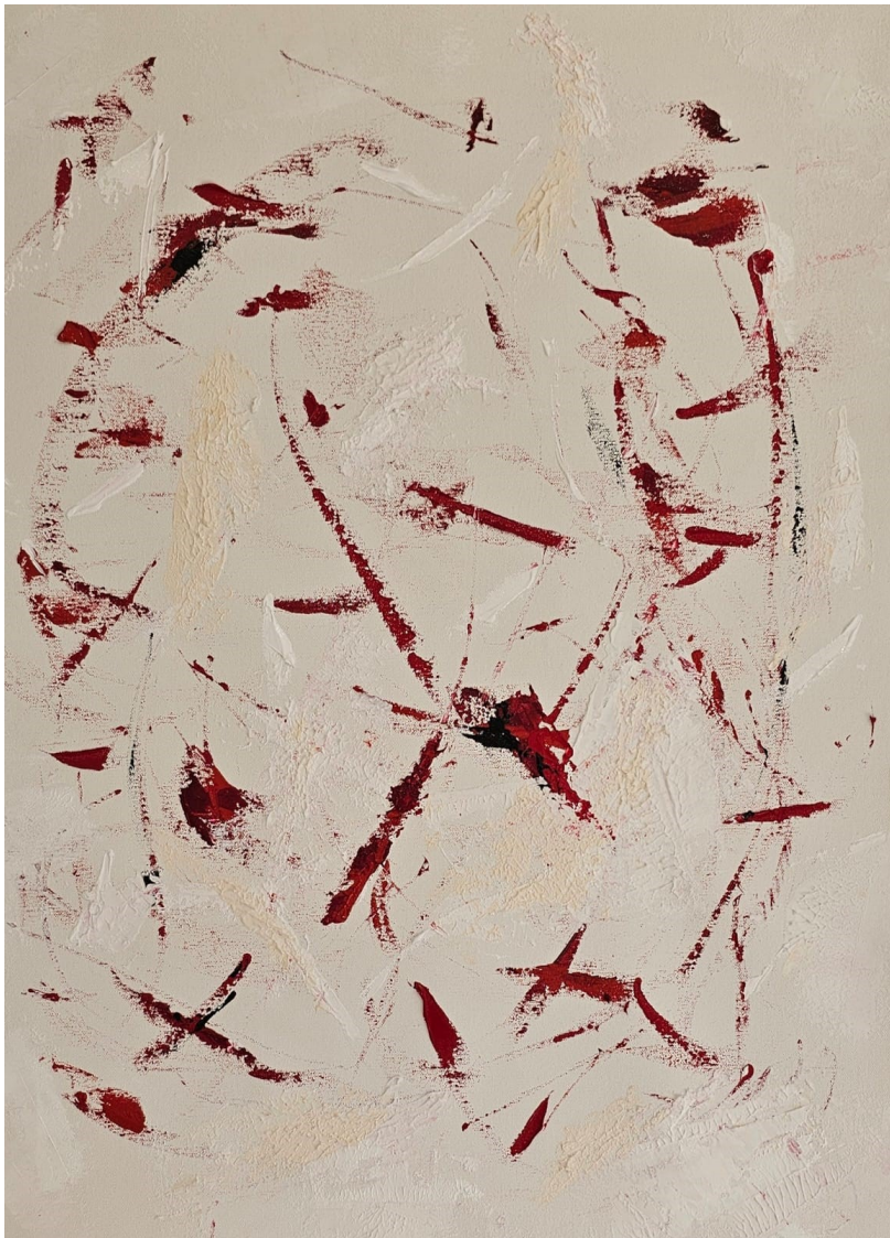
Artista: Flavia Fabbriani Suturas I, 2024 Técnica mista 64 x 51,3 cm