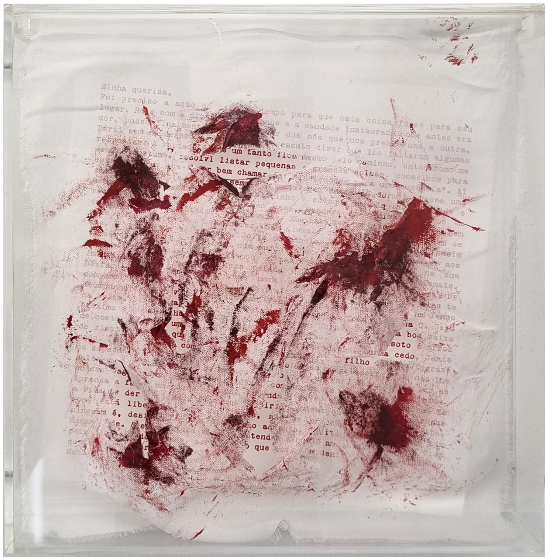
Artista: Flavia Fabbriziani conSANGUINEUS XII, 2024 Técnica mista 25 x 25 x 5 cm