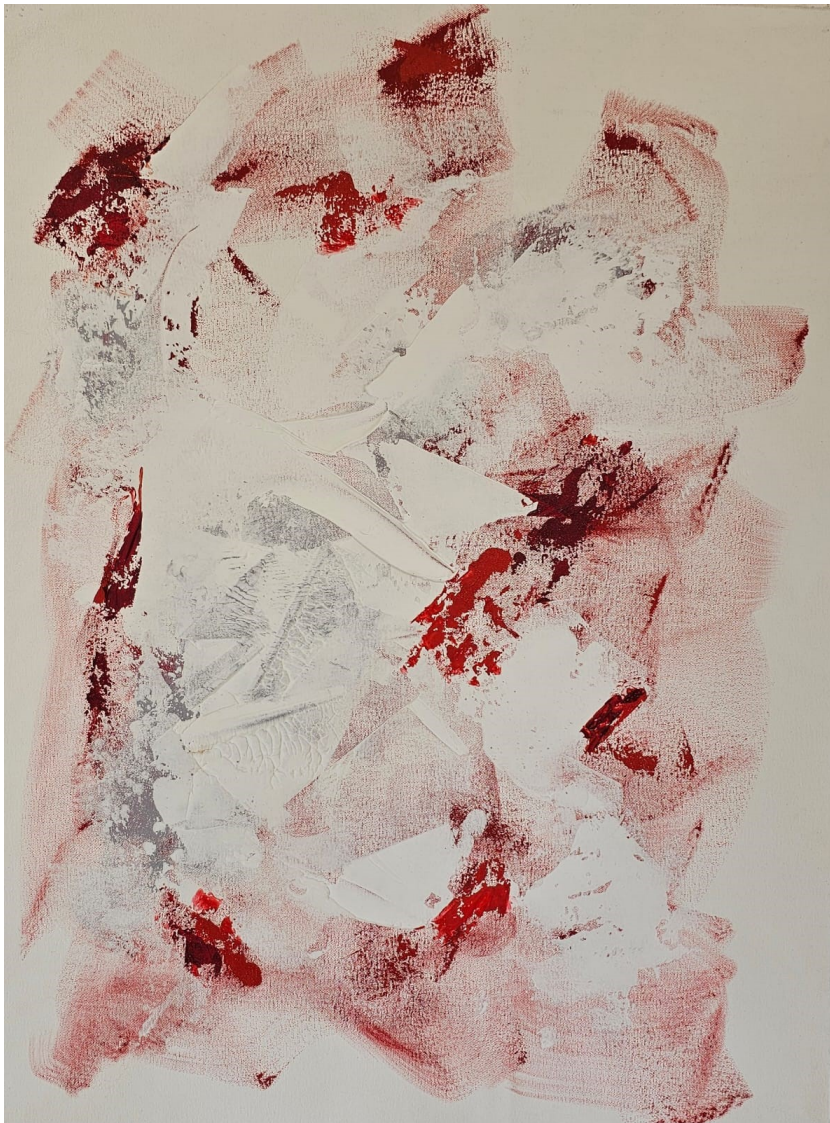
Artista: Flavia Fabbriziani Suturas II, 2024 Técnica mista 64 x 51,3 cm