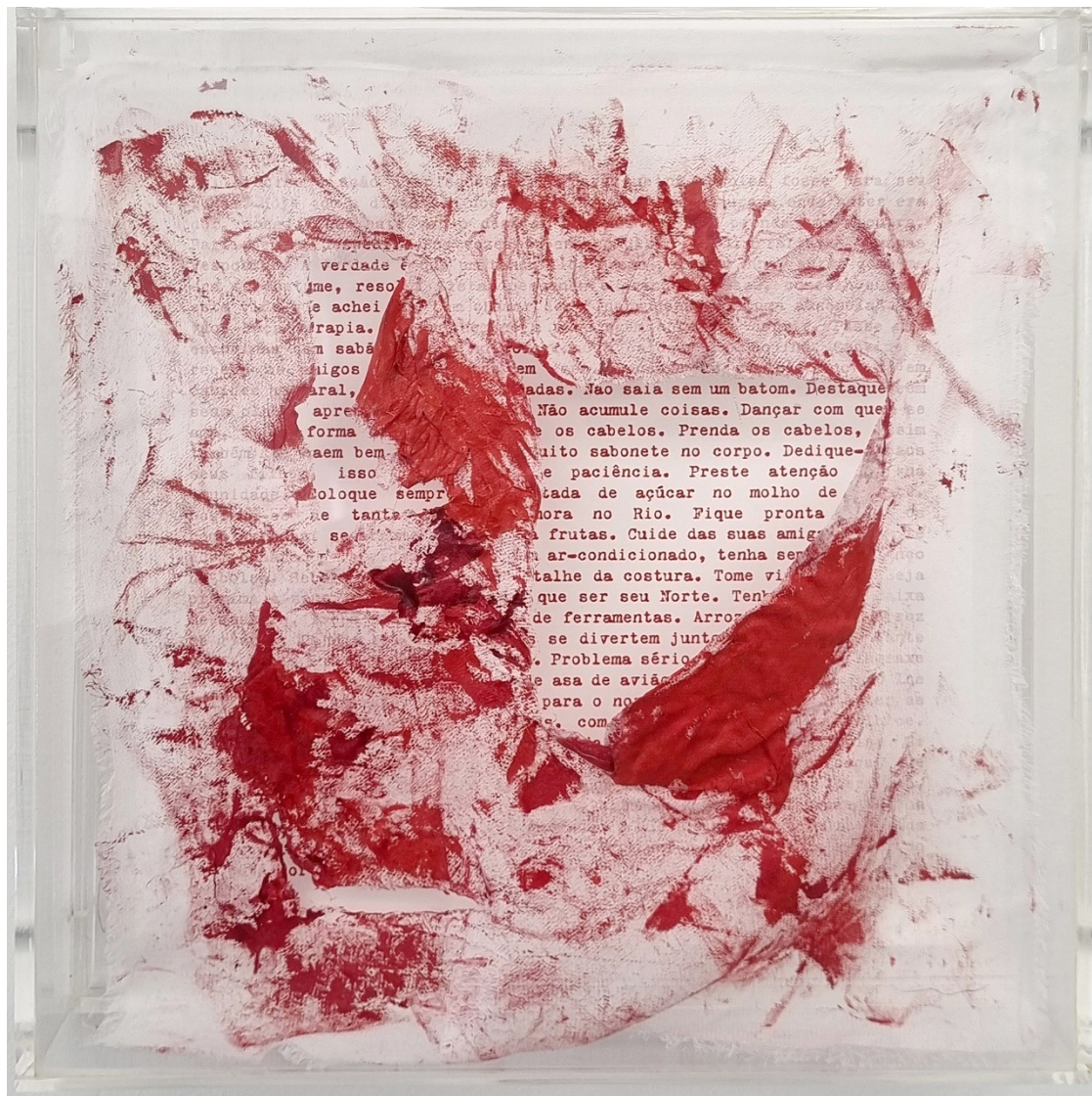
Artista: Flavia Fabbriziani conSANGUINEUS XVI, 2024 Técnica mista 25 x 25 x 5 cm