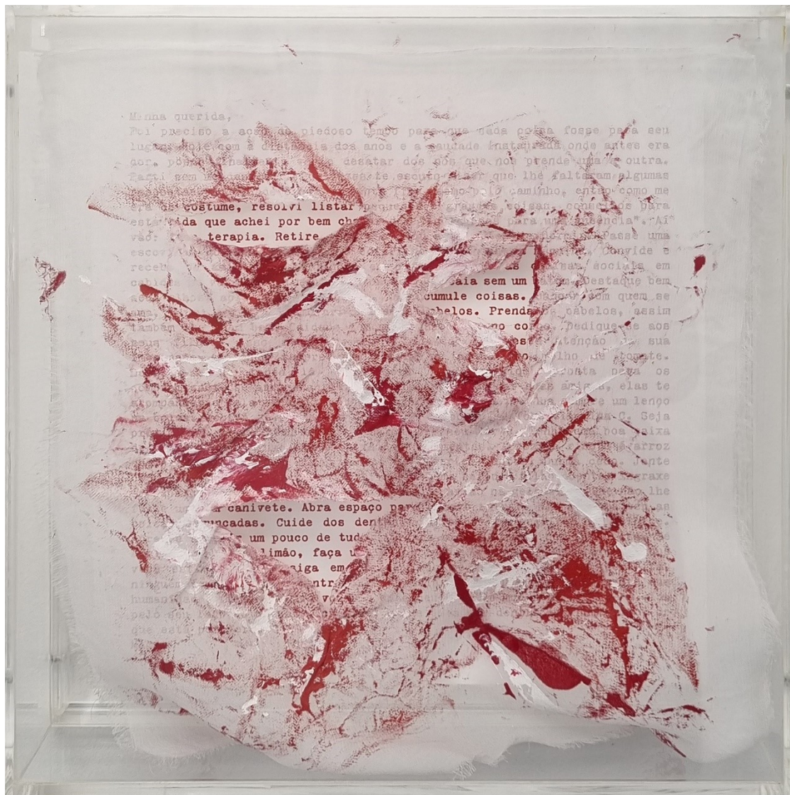
Artista: Flavia Fabbriziani conSANGUINEUS II, 2024 Técnica mista 25 x 25 x 5 cm