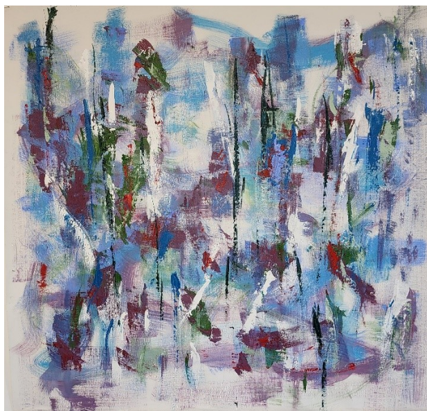
Artista: Flavia Fabbriziani 36387122 / 36387123, 2023 Acrilica sobre tela 77 x 77 cm (cada)