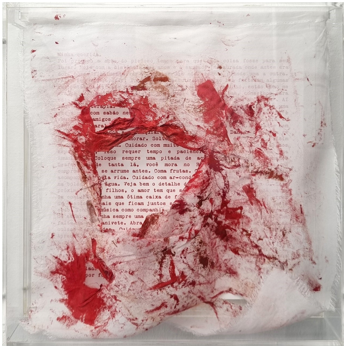
Artista: Flavia Fabbriziani conSANGUINEUS III, 2024 Técnica mista 25 x 25 x 5 cm