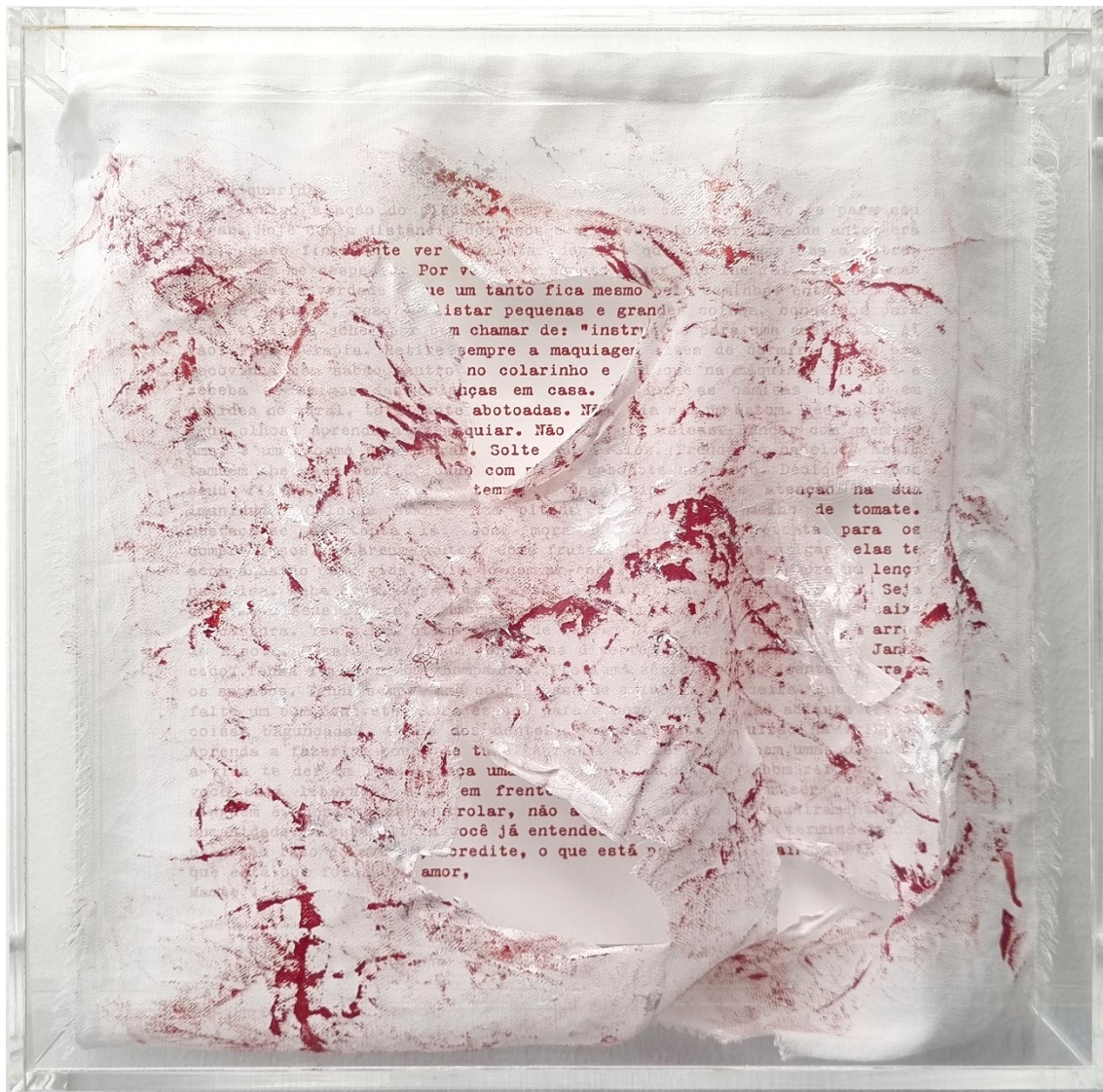
Artista: Flavia Fabbriziani conSANGUINEUS IX, 2024 Técnica mista 25 x 25 x 5 cm