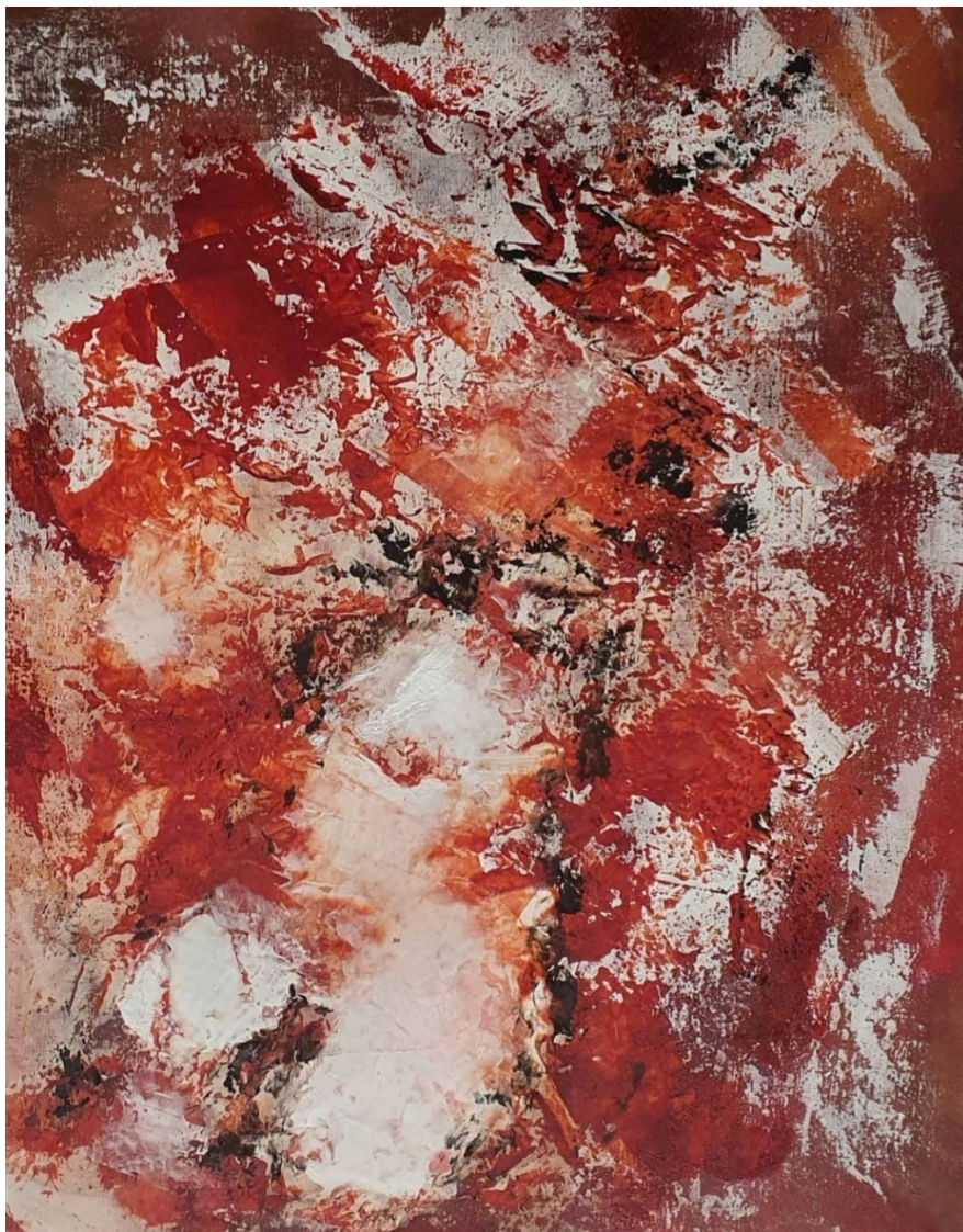
Artista: Flavia Fabbriziani Reverência, 2020 Técnica mista 68 x 52 cm