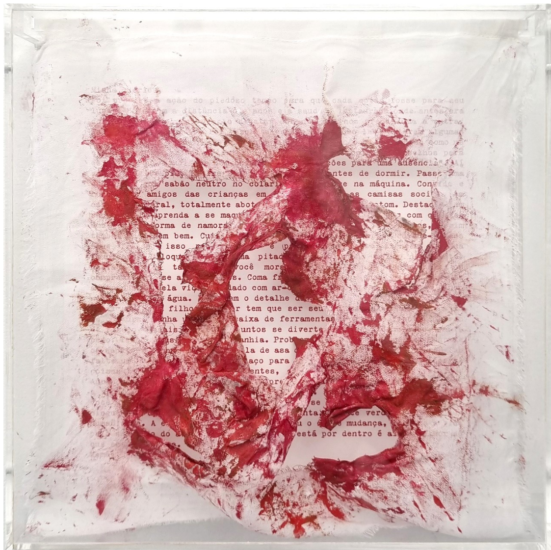
Artista: Flavia Fabbriziani conSANGUINEUS XVII, 2024 Técnica mista 25 x 25 x 5 cm