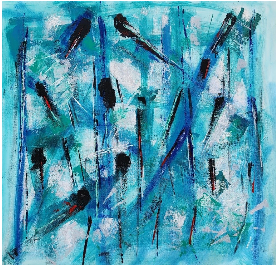
Artista: Flavia Fabbriziani 36387129, 2023 Acrilica sobre tela 77 x 77 cm