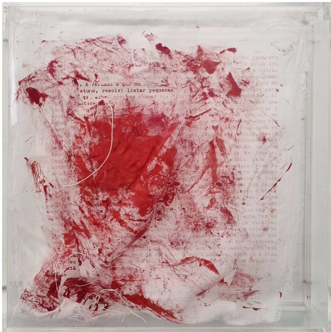
Artista: Flavia Fabbriziani conSANGUINEUS XIV, 2024 Técnica mista 25 x 25 x 5 cm