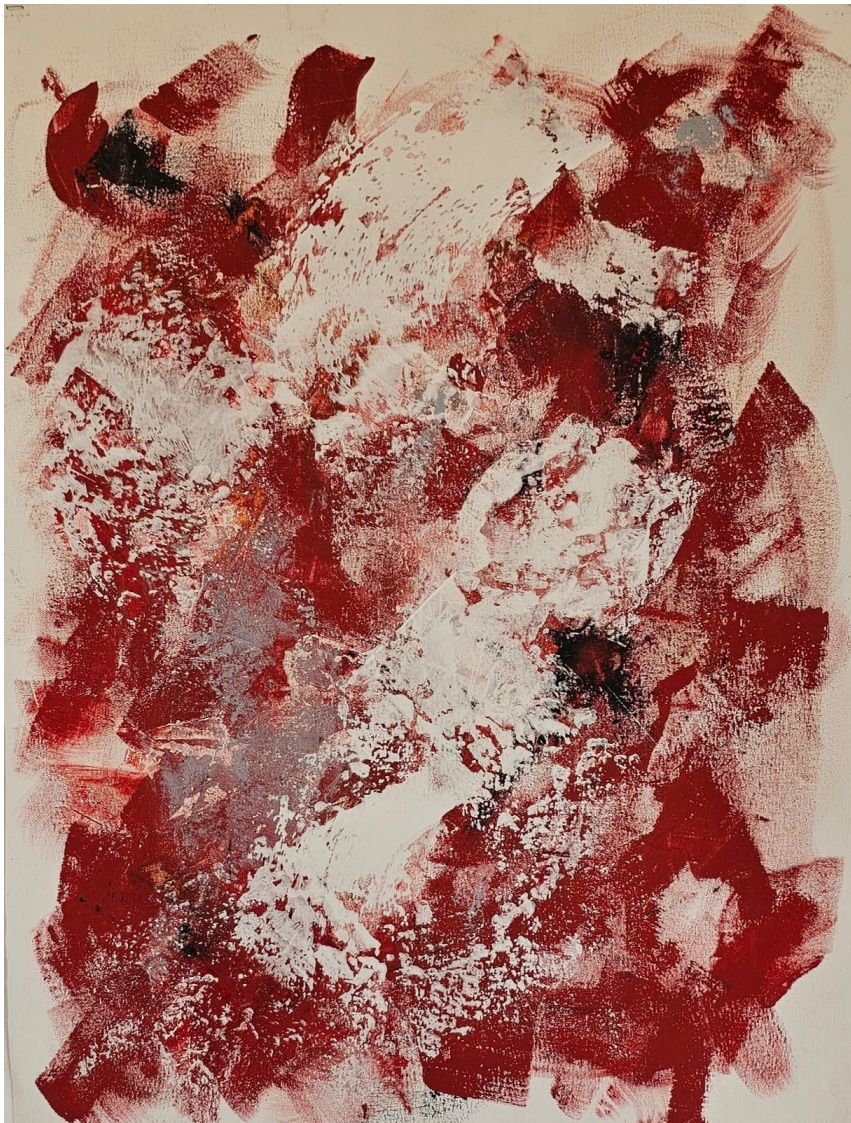
Artista: Flavia Fabbriani Suturas IV, 2024 Técnica mista 64 x 51,3 cm