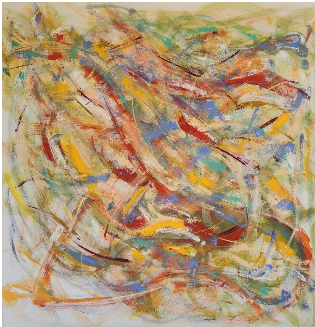
Artista: Flavia Fabbriziani 36387135, 2023 Acrílica sobre tela 151 x 151 cm