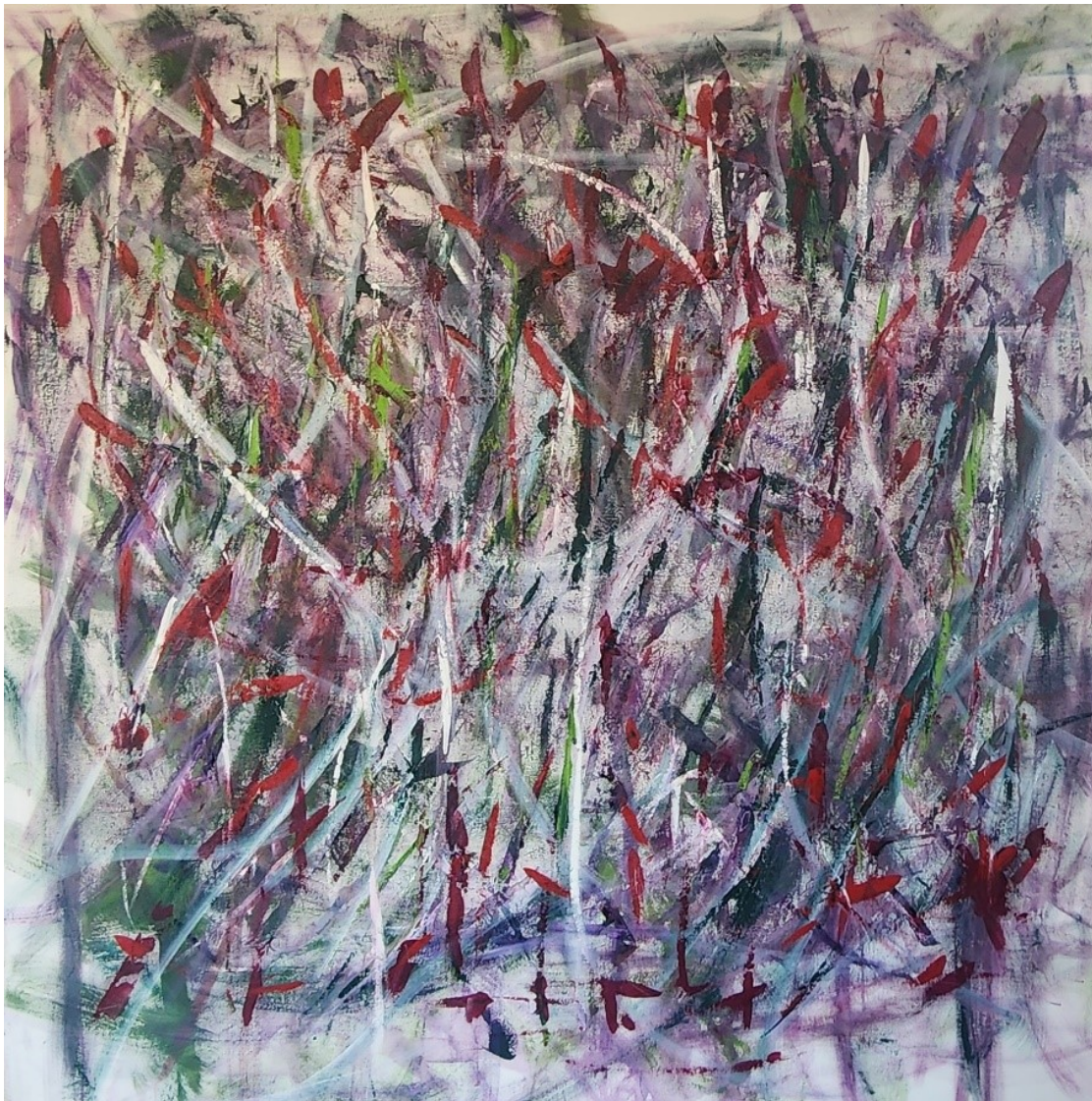
Artista: Flavia Fabbriziani 36387126, 2023 Acrílica sobre tela 151 x 151 cm