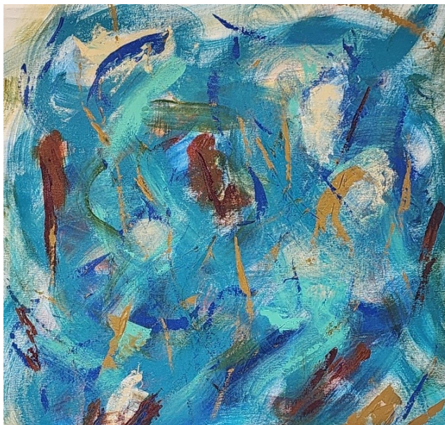
Artista: Flavia Fabbriziani 36387131 / 36387132, 2023 Acrilica sobre tela 71 x 71 cm (cada)