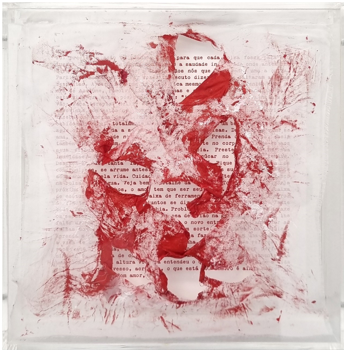
Artista: Flavia Fabbriani conSANGUINEUS XVIII, 2024 Técnica mista 25 x 25 x 5 cm