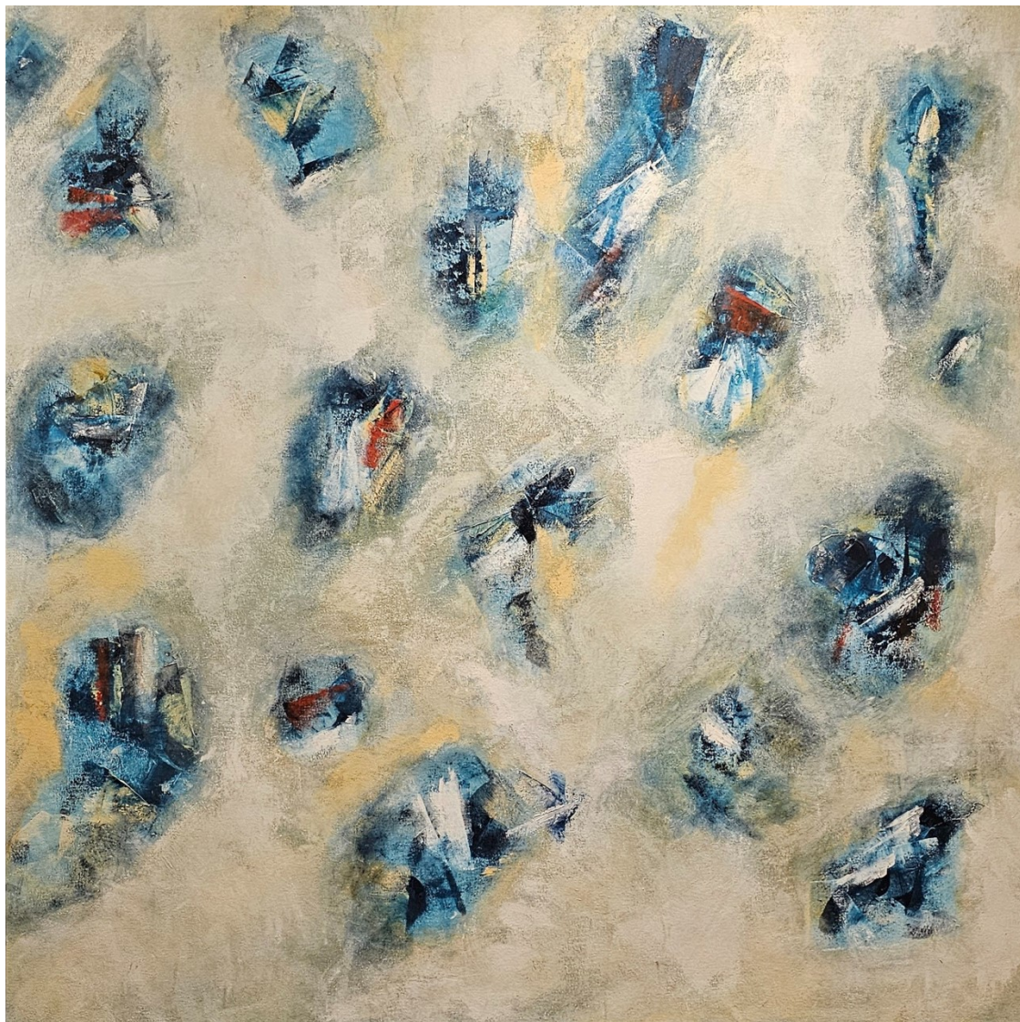
Artista: Flavia Fabbriani 36387116, 2022 Acrílica sobre tela 151 x 151 cm