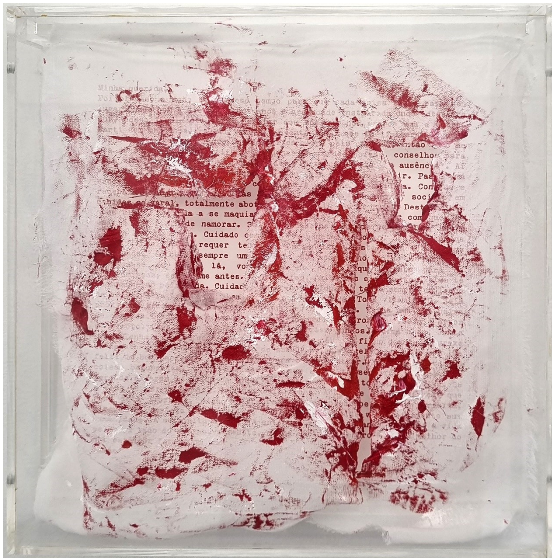
Artista: Flavia Fabbriani conSANGUINEUS XV, 2024 Técnica mista 25 x 25 x 5 cm