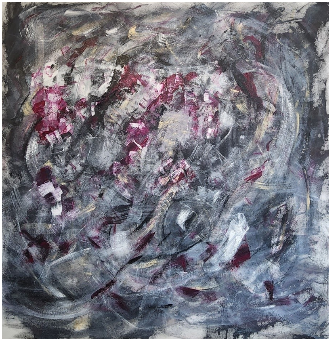
Artista: Flavia Fabbriziani 36387118, 2022 Acrílica sobre tela 151 x 151 cm