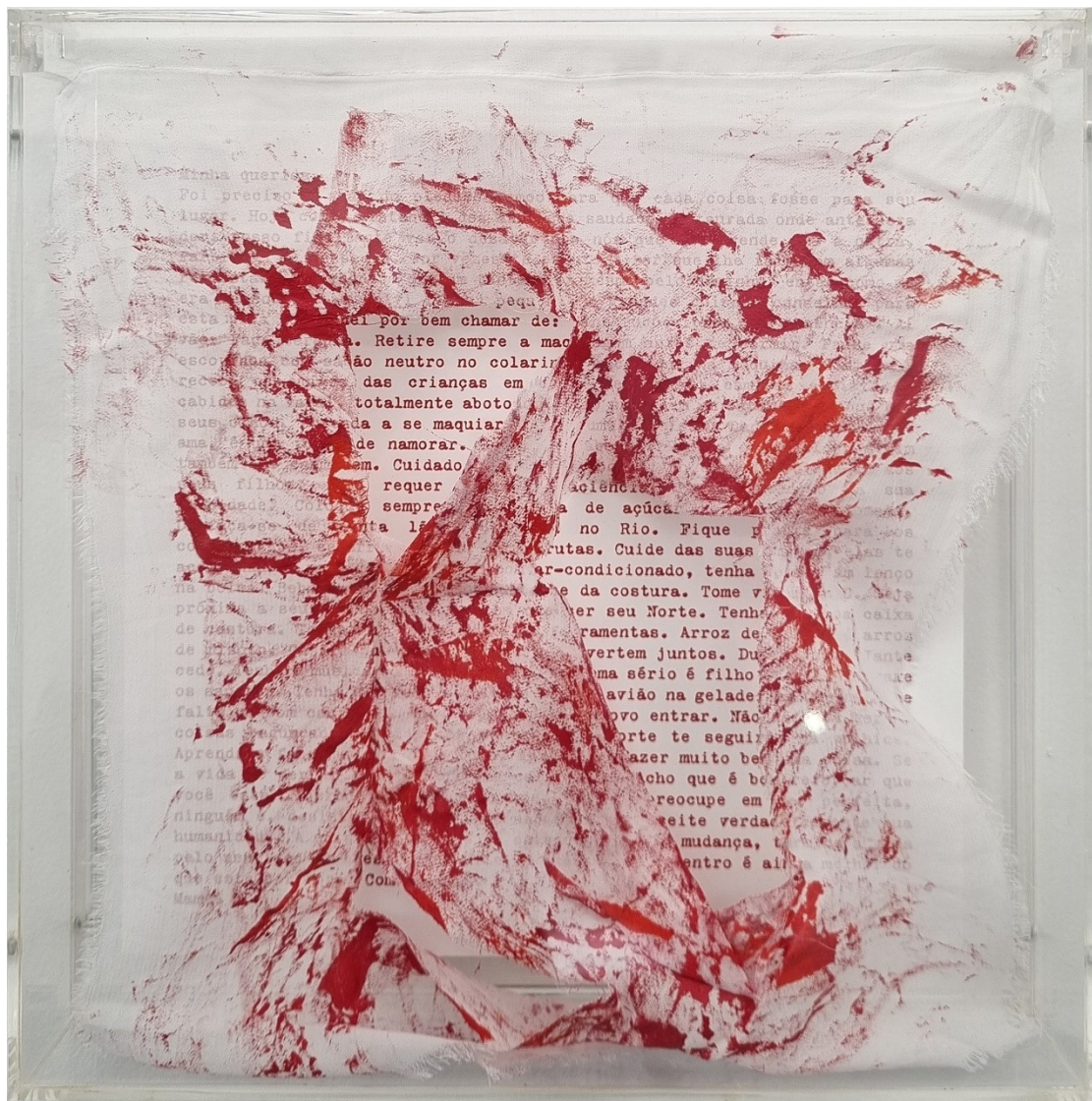
Artista: Flavia Fabbriziani conSANGUINEUS X, 2024 Técnica mista 25 x 25 x 5 cm