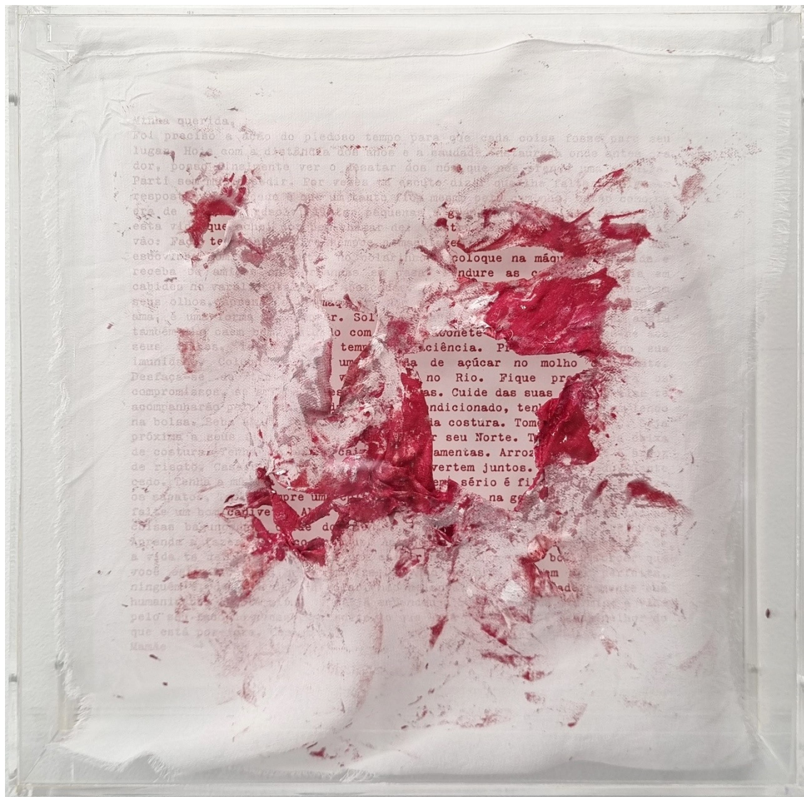
Artista: Flavia Fabbriziani conSANGUINEUS XIX, 2024 Técnica mista 25 x 25 x 5 cm