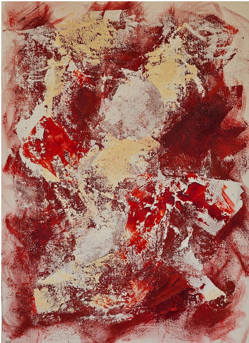
Artista: Flavia Fabbri Suturas III, 2024 Técnica mista 64 x 51,3 cm