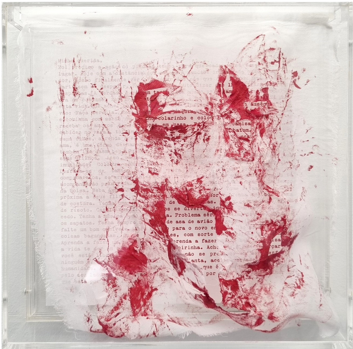
Artista: Flavia Fabbriziani conSANGUINEUS VI, 2024 Técnica mista 25 x 25 x 5 cm