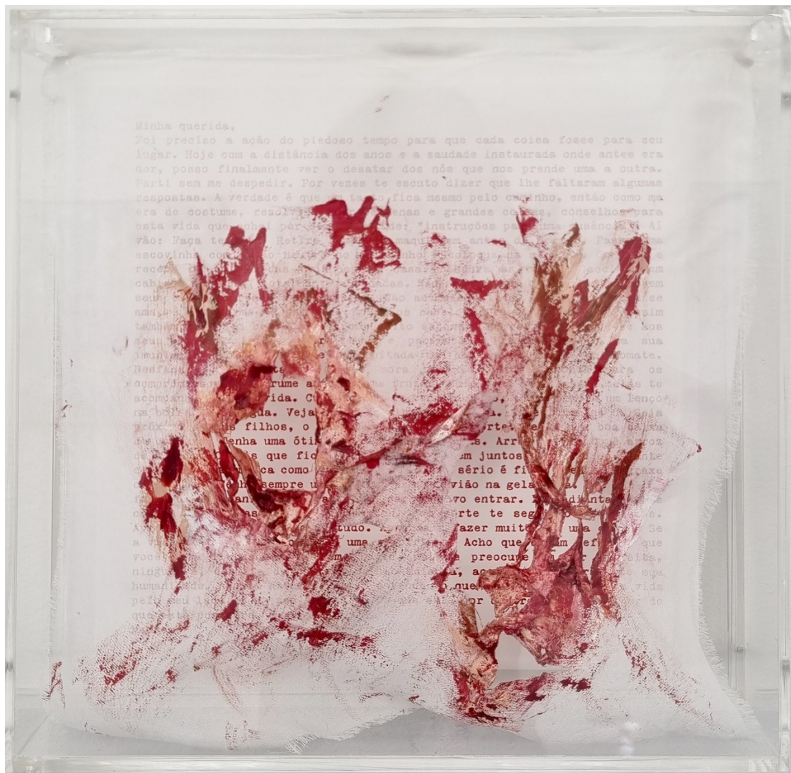
Artista: Flavia Fabbriziani conSANGUINEUS VIII, 2024 Técnica mista 25 x 25 x 5 cm