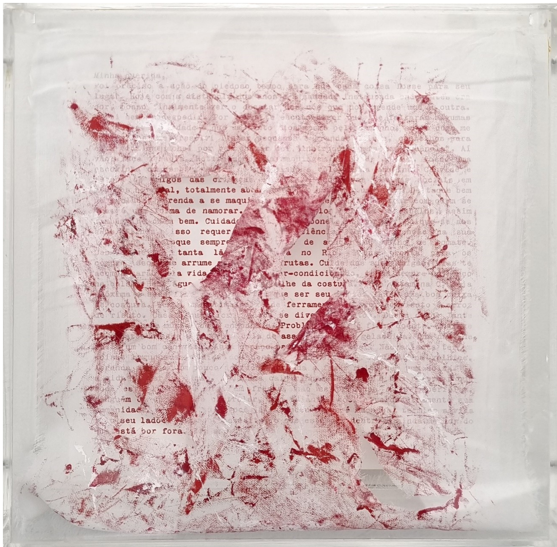
Artista: Flavia Fabbriziani conSANGUINEUS I, 2024 Técnica mista 25 x 25 x 5 cm