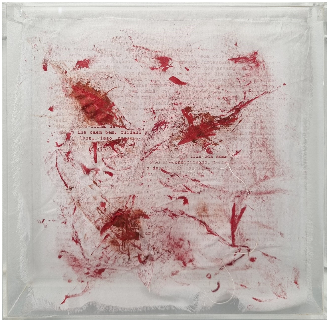
Artista: Flavia Fabbriziani conSANGUINEUS XI, 2024 Técnica mista 25 x 25 x 5 cm