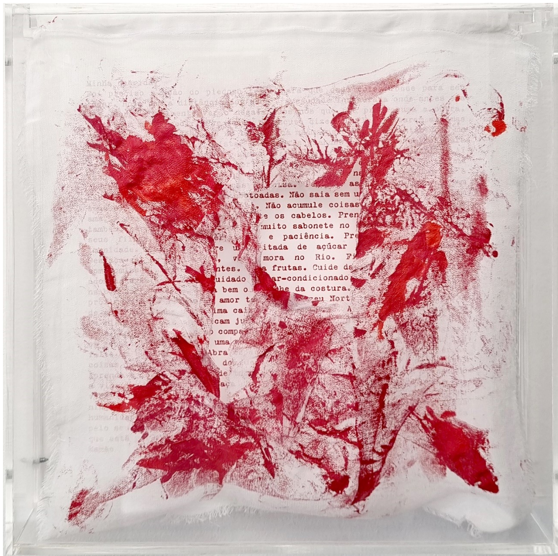
Artista: Flavia Fabbriziani conSANGUINEUS VII, 2024 Técnica mista 25 x 25 x 5 cm