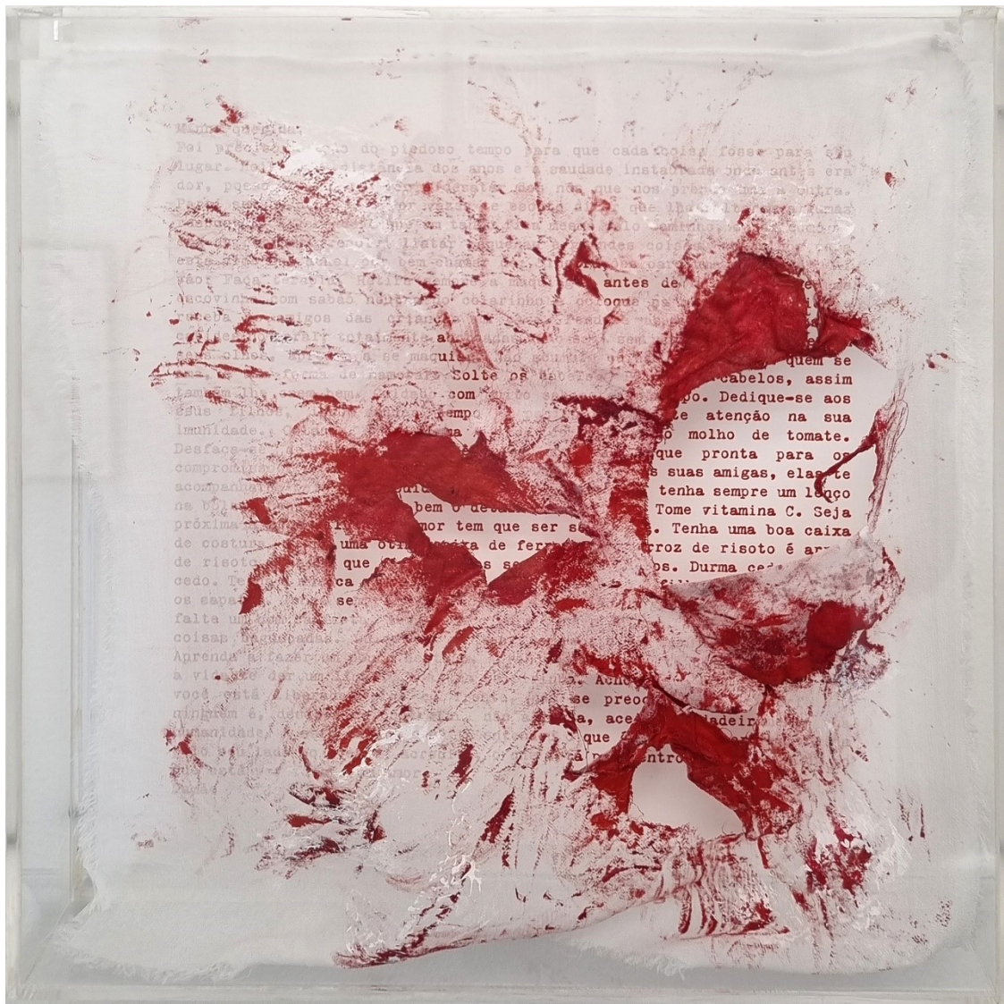
Artista: Flavia Fabbri conSANGUINEUS V, 2024 Técnica mista 25 x 25 x 5 cm