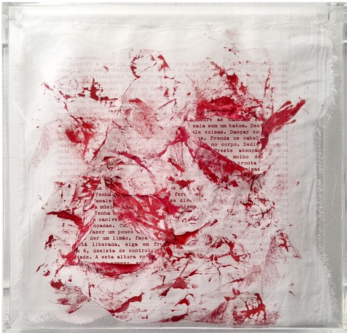
Artista: Flavia Fabbriziani conSANGUINEUS IV, 2024 Técnica mista 25 x 25 x 5 cm