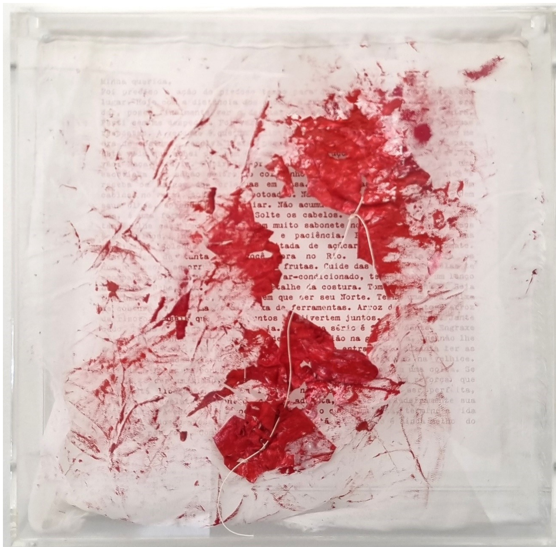
Artista: Flavia Fabbriziani conSANGUINEUS XIII, 2024 Técnica mista 25 x 25 x 5 cm